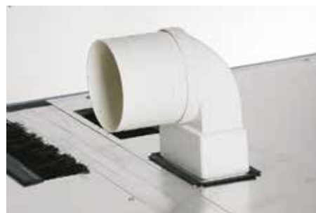
Lüftungsanschluss auf dem Dach oder im Hohlboden