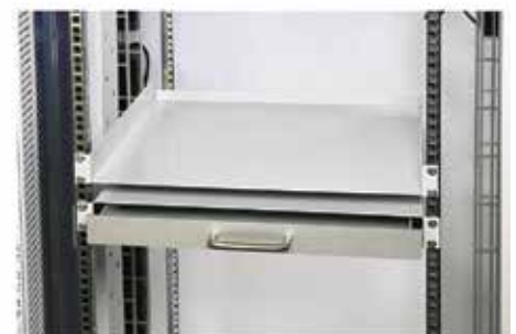
Diverse 19"-Auszüge und Tableare