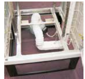
Lüftungsanschluss über Hohlboden-Ventilator